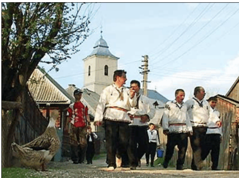
Fig. 6. Aspect din timpul sărbătorii “Prăcșorul”

Obiceiul care identifică, însă, comuna este colindul practicat de feciorii satului în săptămâna imediat următoare Paștelui: “Prăcșorul” . Bistra este singura comună din zona în care se mai păstrează, de peste 250 de ani, acest obicei (fig. 6).