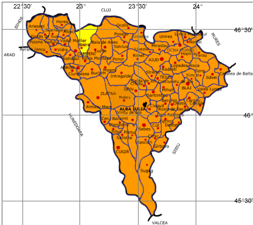
Fig. 1. Amplasarea comunei Bistra în cadrul Județului Alba

Din punct de vedere administrativ, comuna Bistra se învecinează la nord-vest cu orașul Câmpeni, care se află doar la 4 km, la nord județul Cluj, la est comunele Poșaga și Lupșa, la sud Comuna Roșia Montană.