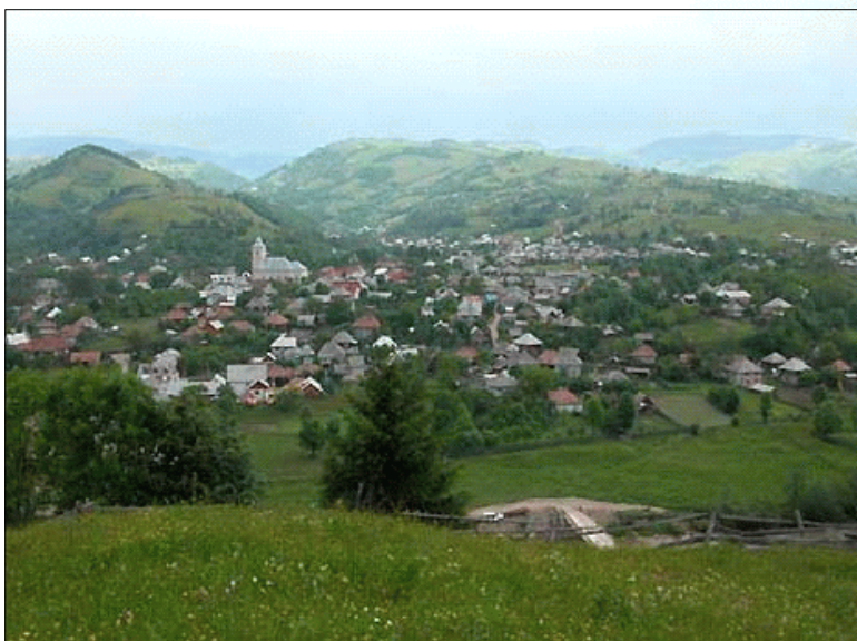
Fig. 3. Comuna Bistra