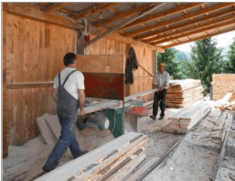
Fig. 5. Fasonarea lemnului într-o microintreprindere din Bistra

Corul bisericii este foarte bun și în el activează din ce în ce mai mulți copii. Se mai afla în construcție o biserică ortodoxă în satul Gârde.